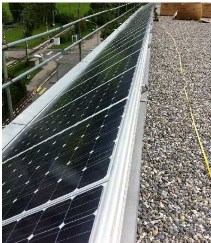
l'installation photovoltaïque est Agna à Moudon .