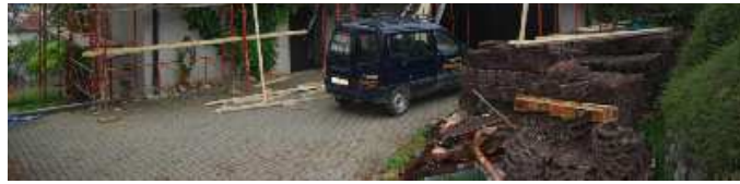
Etablissement du CECB et conseil rénovation