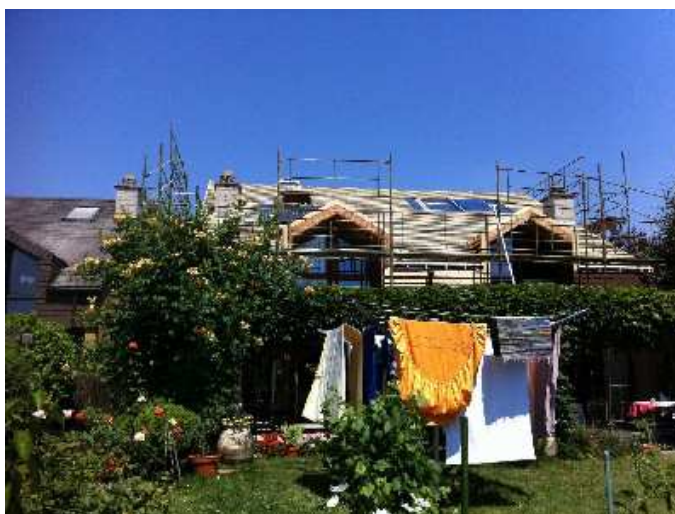
Isolation de la toiture, pose de panneaux solaires et isolation du mur extérieur.