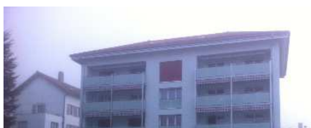
Bâtiment isolé entièrement et terminé. Le confort est amélioré, la coupure des ponts thermiques effectués en

Notre mandat: suivi des travaux d'après les études que nous avons menées